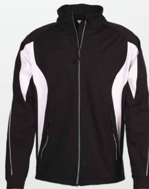
747 - Black/White