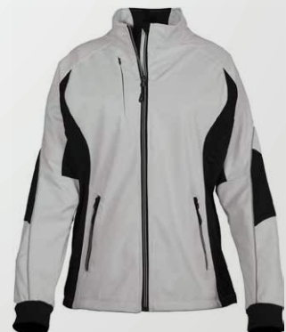
749 - White/Black